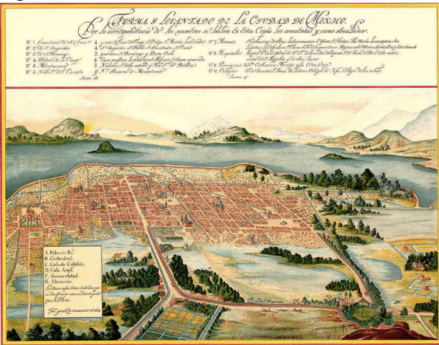
Juan Gomez de Trasmonte, «Plan de la ville de Mexico», 1628, Musée de la ville, Mexico.

Dès la fin du XVI e siècle, Mexico porte les marques de la colonisation espagnole : cathédrales, palais des vices-rois et églises disséminées dans toute la ville.